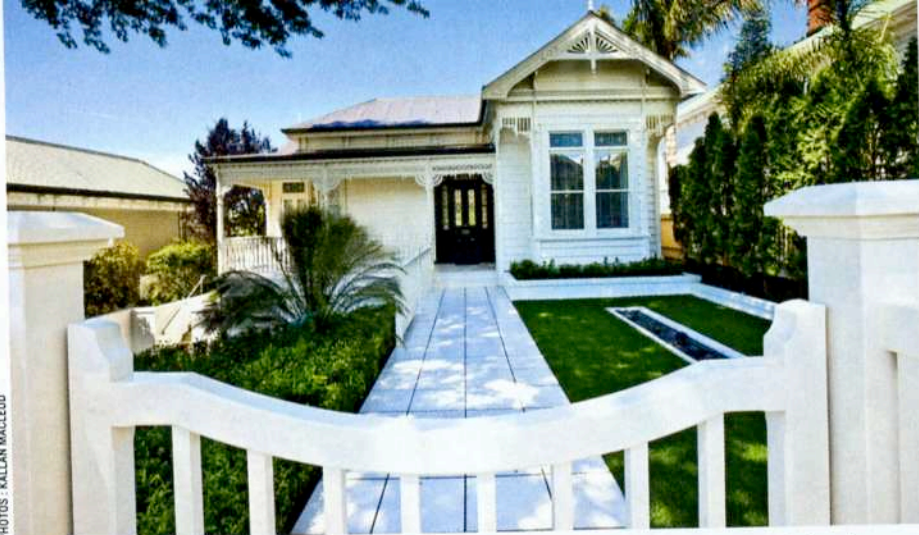
Le troc de maisons se pratique sur tous les continents : ici, une demeure néo-zélandaise située dans la banlieue chic d'Auckland, pour couler des jours heureux au bord d'une piscine de milliardaire.